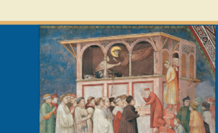
Giotto, Il miracolo di San Francesco in Campania: la resurrezione di un fanciullo di Sessa. Assisi, Basilica di San Francesco