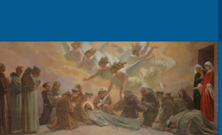
Domenico Bruschi, La morte di San Francesco. Assisi, Basilica di Santa Maria degli Angeli in Porziuncola